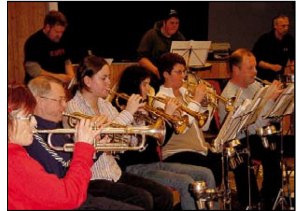
Follebu Musikkforening inviterer til jubileumskonert og fest i Follebu bygdehus lørdag den 31. januar.

- Jo, flere folk. Jo flere ideer kommer opp og står, sier Jensen.