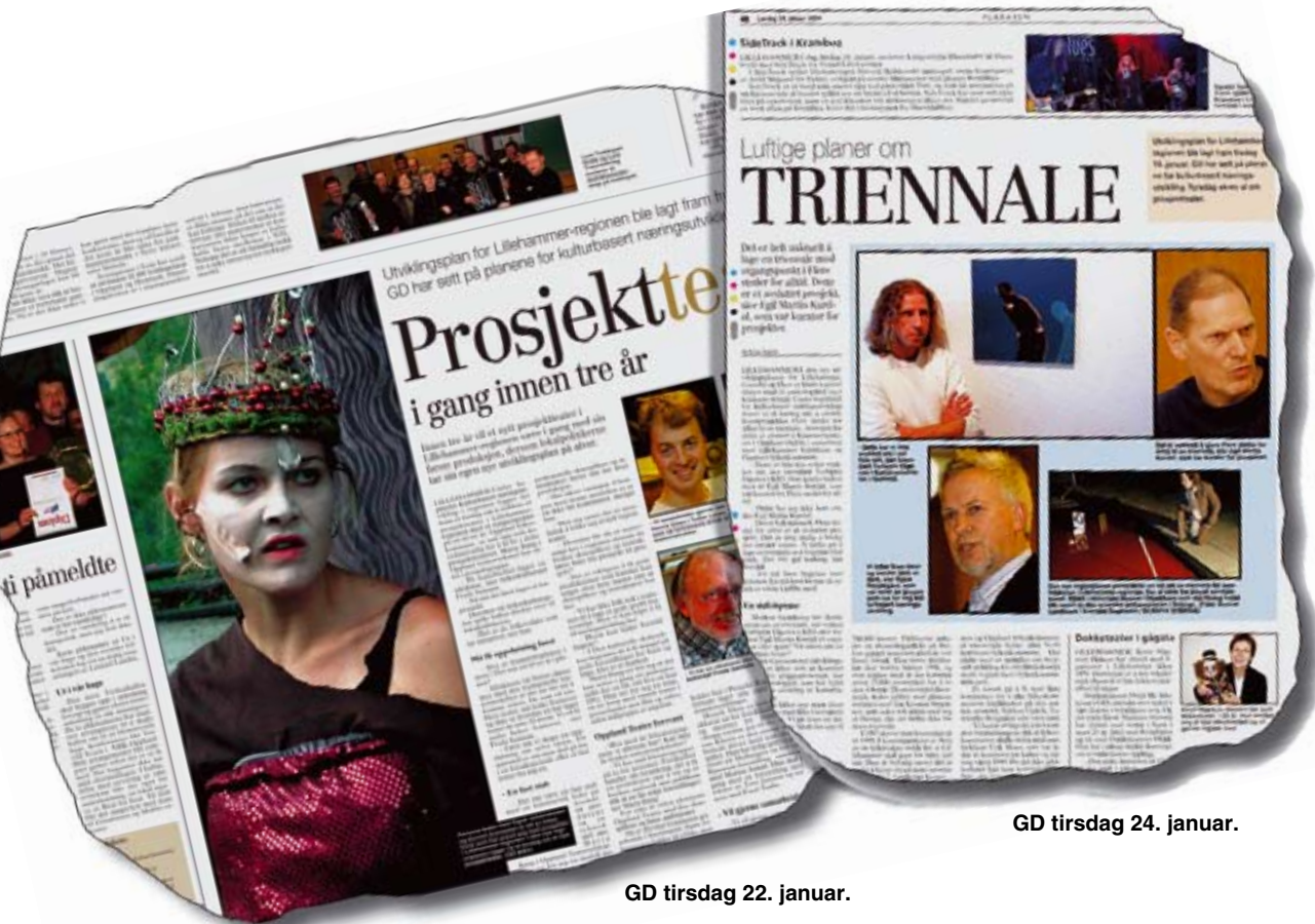
GD tirsdag 22. januar.

Utviklingsplan for Lillehammer-regionen ble lagt fram 16. januar. GD har sett på planene for kulturbasert næringsutvikling. Tidligere artikler: 22. januar: Prosjektteater, 24. januar: triennale. I dag: Film.